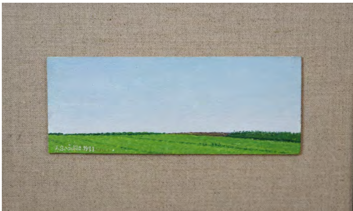
Jakob Bräckle Grüne Felderlandschaft 1934 Oe auf Platte, 15 x 30,5 cm Signiert und datiert