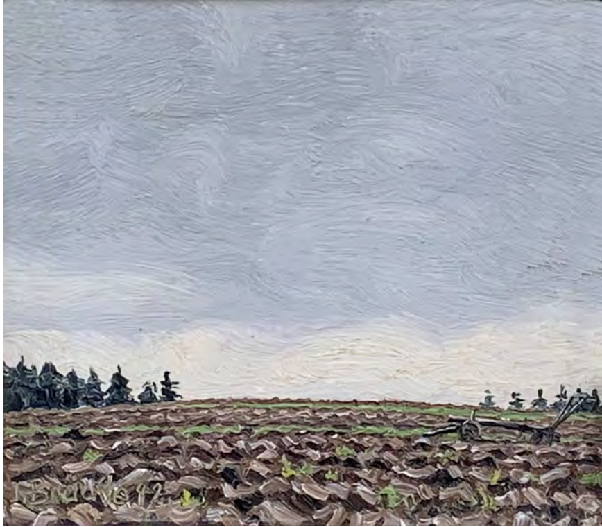
Jakob Bräckle Frisch gepflügte Feld 1942 Oel auf Platte, 15 x 17 cm Signiert und datiert