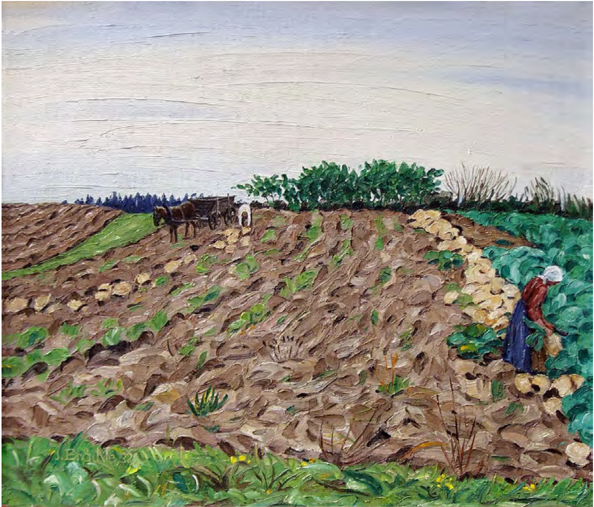
Jakob Bräckle Im Rübenfeld 1932 Oel auf Leinwand 60 x 70 cm Signiert und datiert