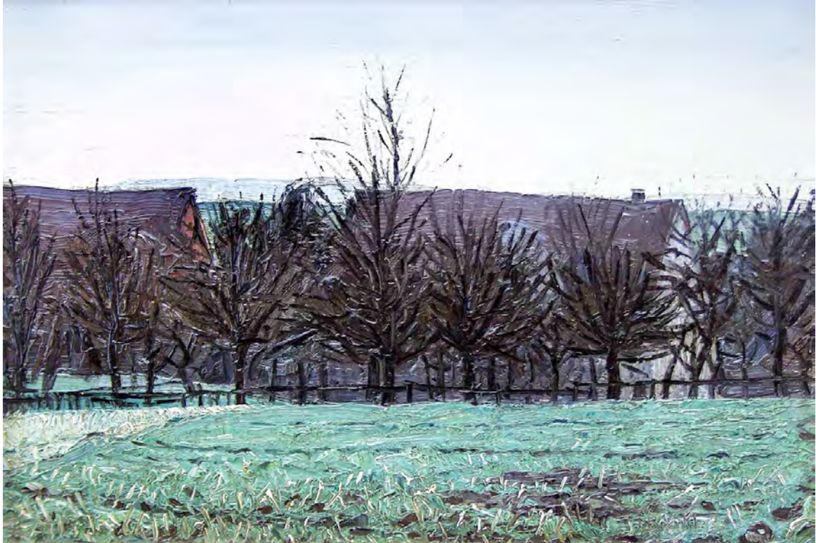
Jakob Bräckle Morgenlandschaft 1935 Öl auf Malkarton, 24,8 x 37 cm Signiert und datiert