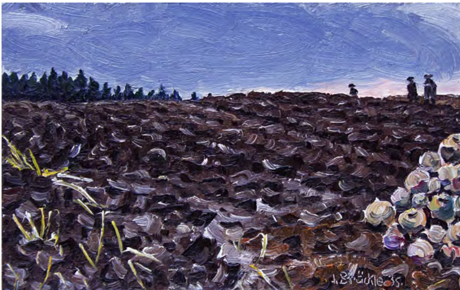
Jakob Bräckle Acker im Herbst 1935 Oel auf Karton, 13 x 20,8 cm Signiert und datiert