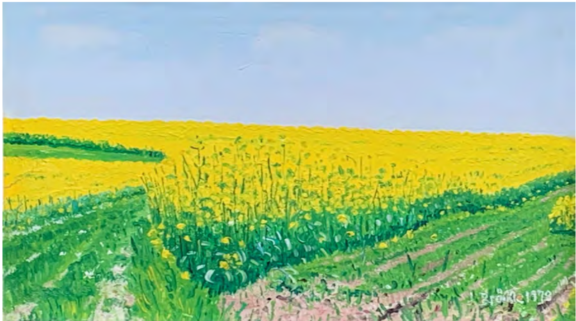
Jakob Bräcke Rapsfeld 1978 Oel auf Platte, 12 x 21 cm Signiert und datiert