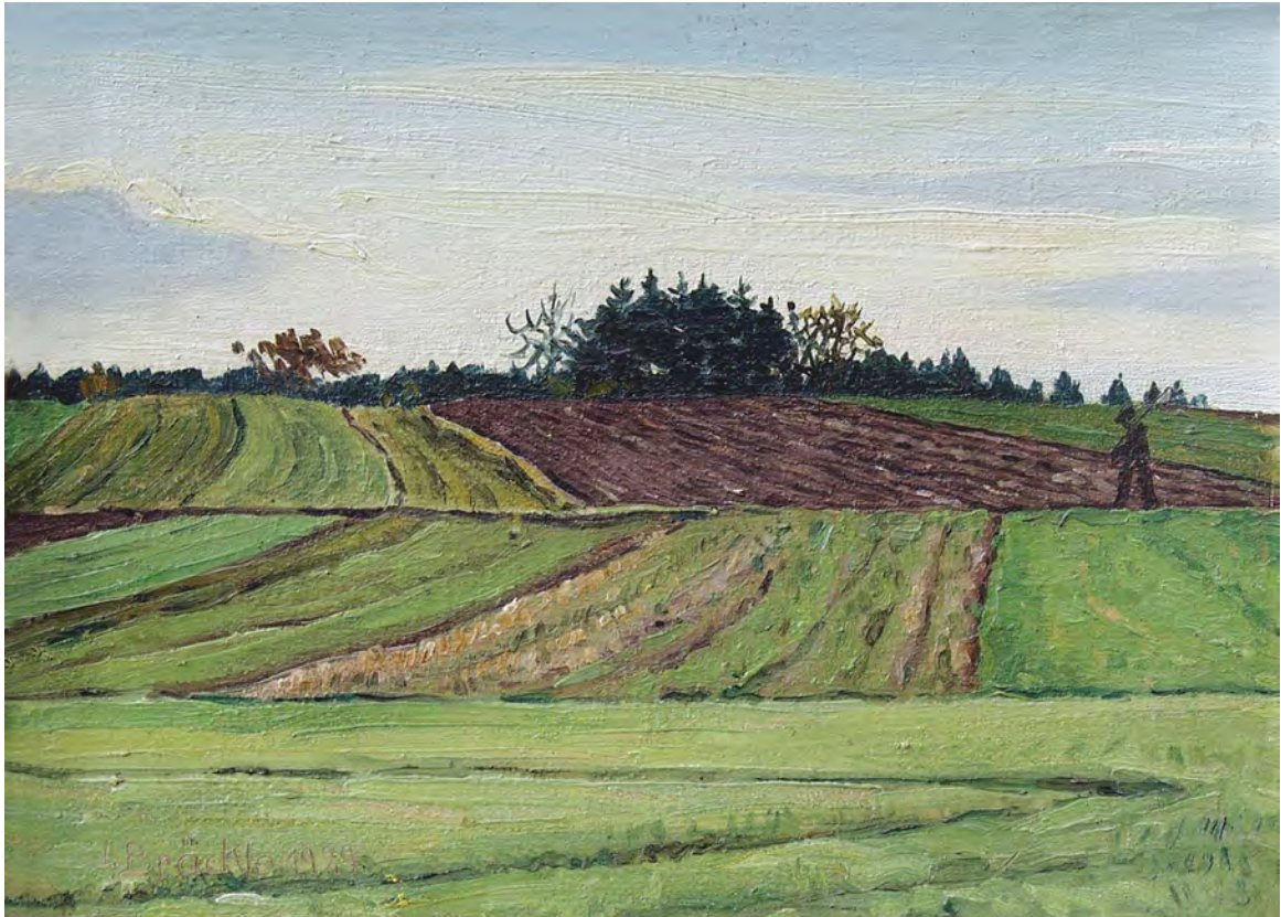
Jakob Bräckle Frühjahr 1929 Oel auf Karton, 19,7 x 27 cm, Signiert und datiert