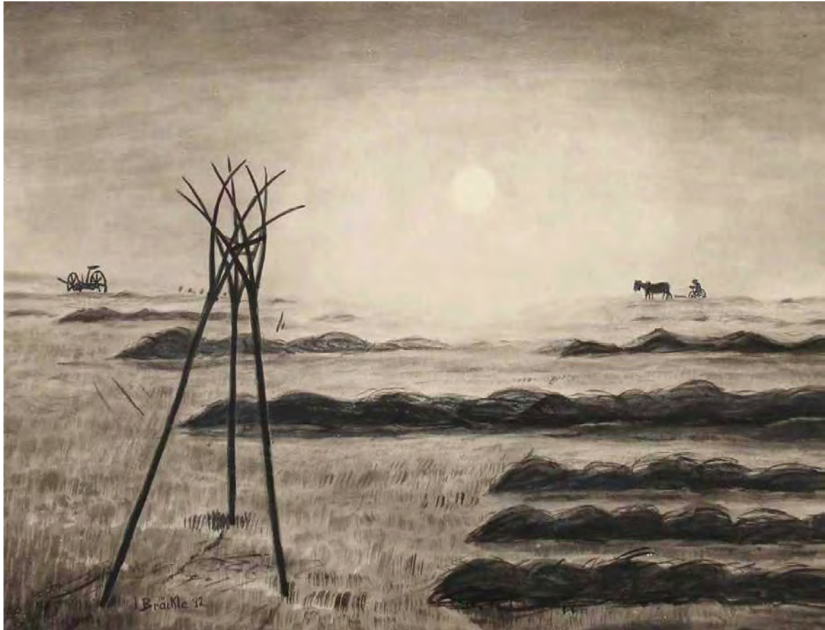
Jakob Bräckle Sommermorgen 1932 Mischtechnik auf Karton, 43,5 56,5 cm Signiert und datiert, rückseitig signiert und bezeichnet Ausstellungsaufkleber des Deutschen Künstlerbundes 1933