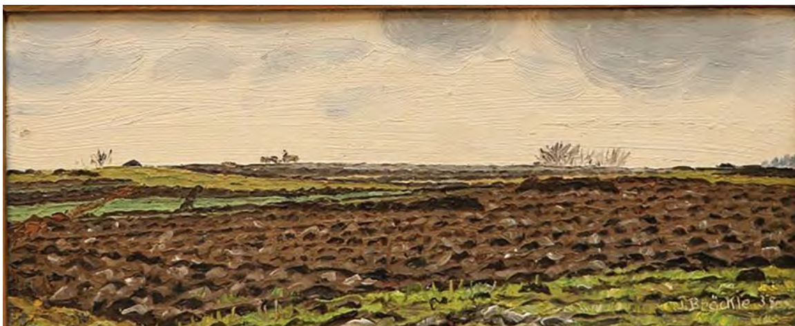
Jakob Bräckle Spätherbst 1935 Oel auf Karton, 13,5 x 33 cm Signiert und datiert