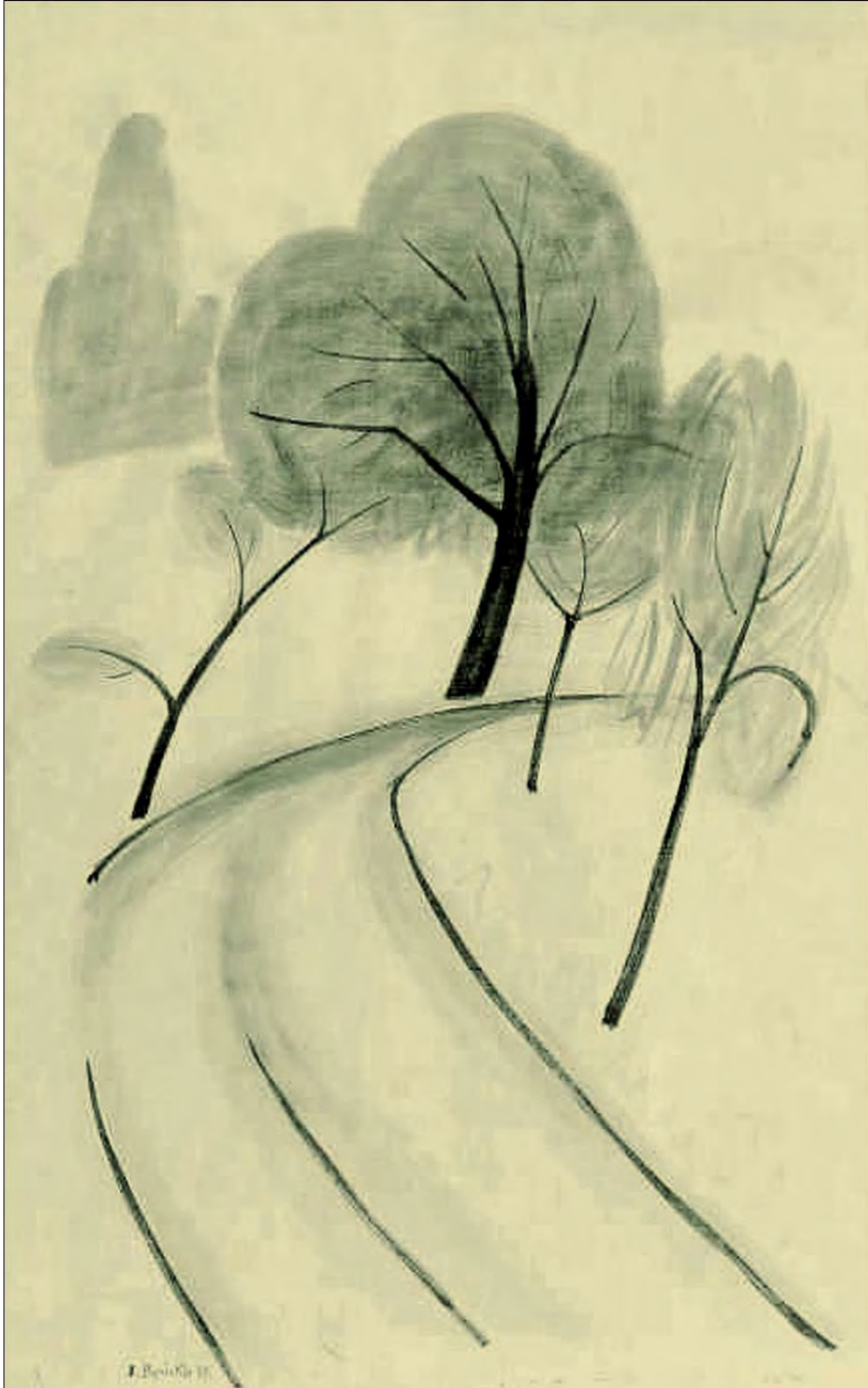
Jakob Bräckle Wegbiegung 1958 Öl auf Leinwand/Karton, 94,5 x 62 cm Signiert und datiert