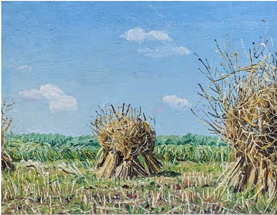
Jakob Bräckle Ernte 1943 Oel auf Platte, 19 x 25 cm Signiert und datiert