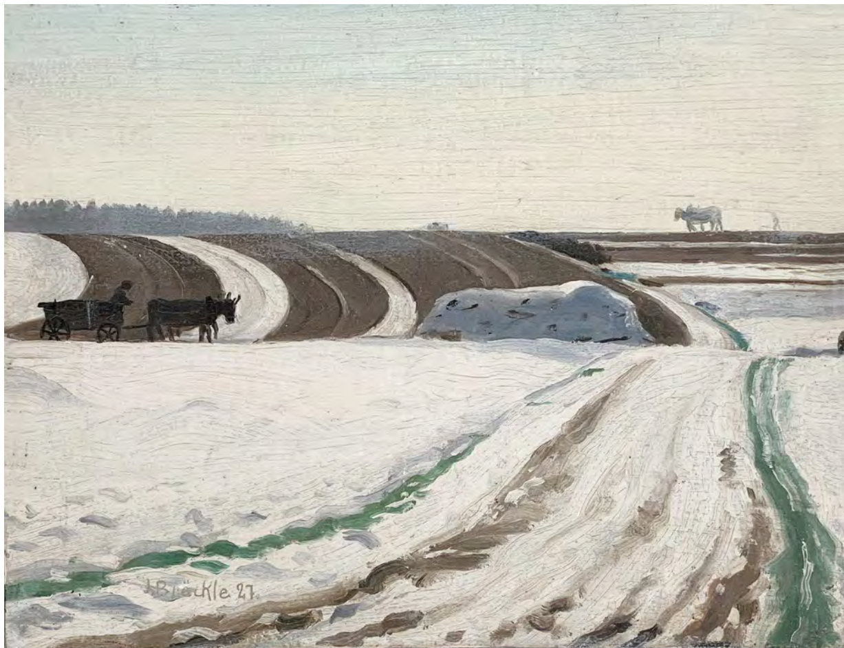
Jakob Bräckle Novemberfelder 1927 Oel auf Karton, 20,3 x 26,3 cm Signiert und datiert