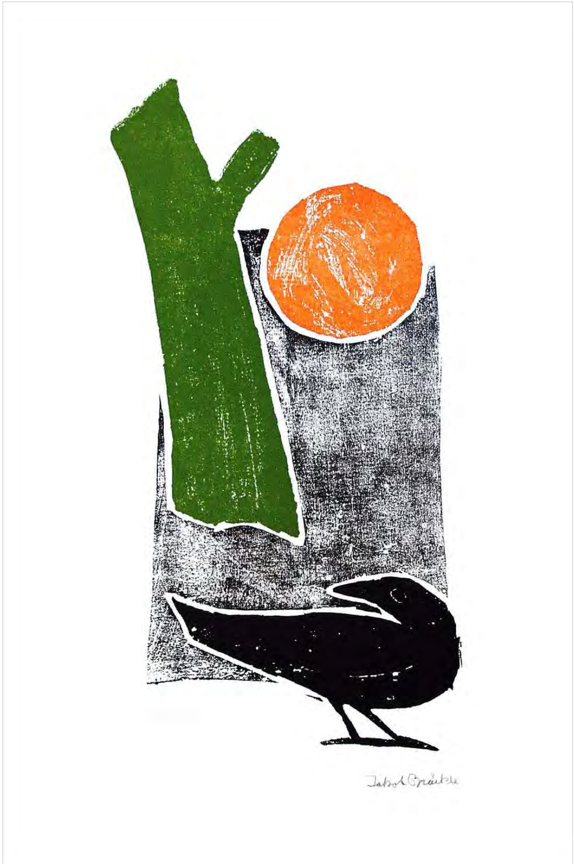
Schwarzer Vogel Farbholzschnitt 35 x 17,5 cm unsignierter Probeabzug