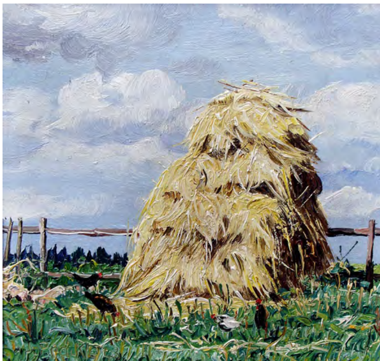
Jakob Bräcke Strohhoeken mit Federvieh Oel auf Karton 16,5 x 17,5 cm