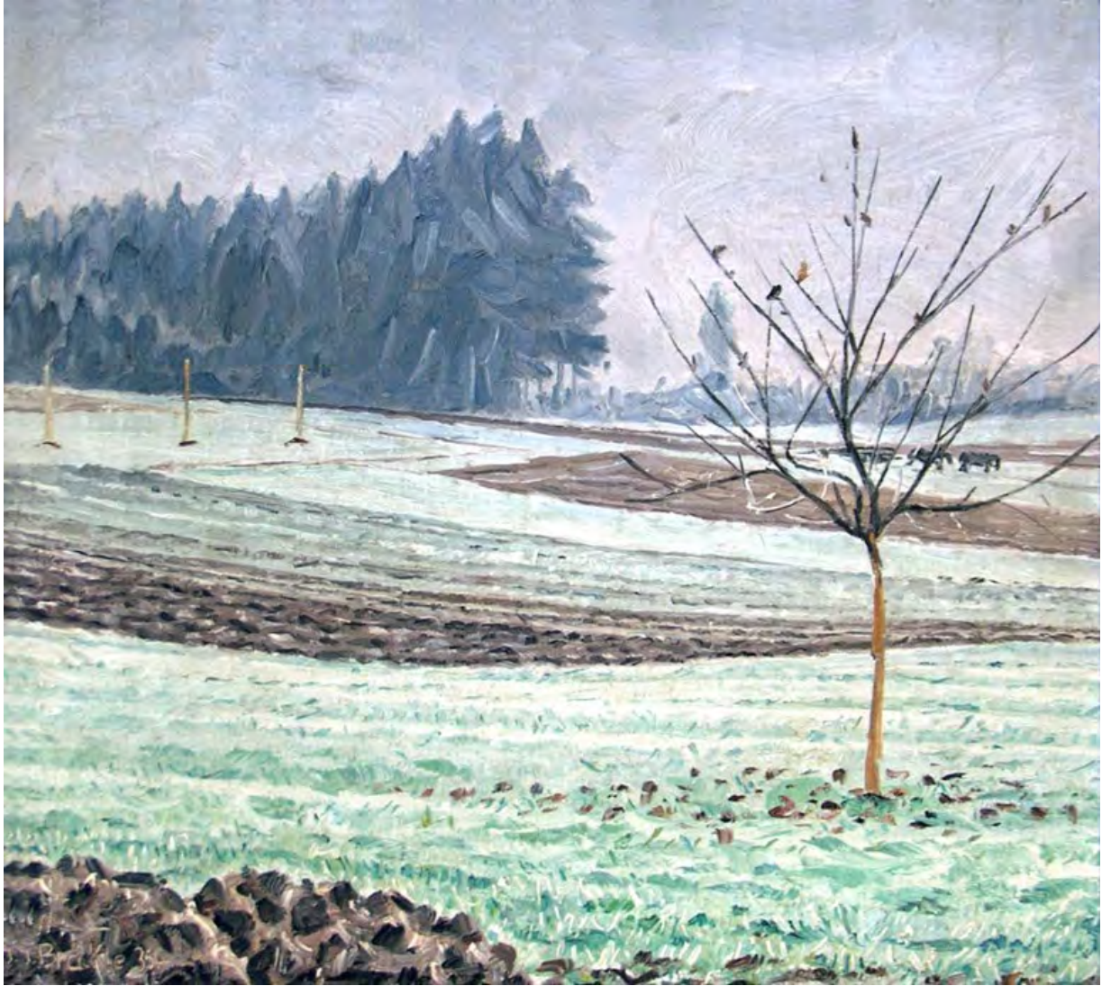
Jakob Bräckle Raureif 1935 Öl auf Leinwand, 39,5 x 43,5 cm Signiert und datiert