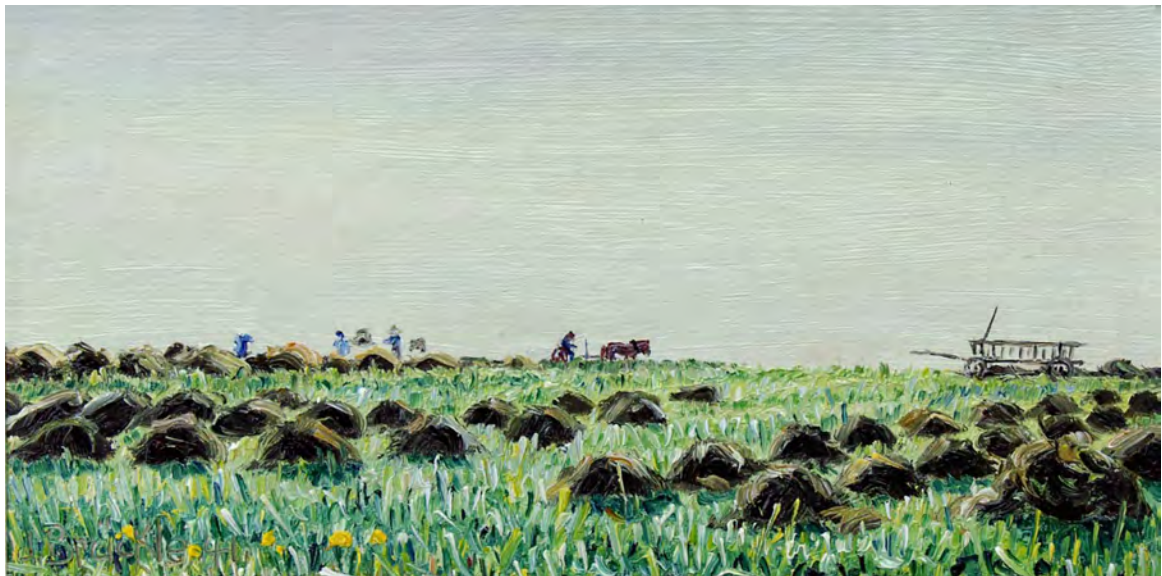
Jakob Bräckle Heuernte im Frühsommer Oel auf Platte, 22,5 x 22,5 cm Signiert und datiert