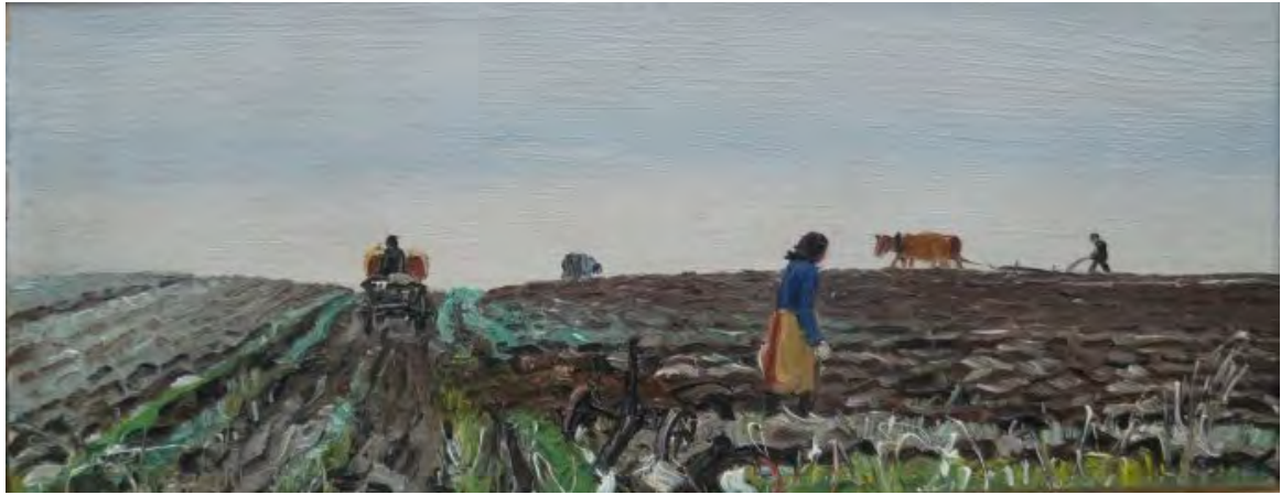
Jakob Bräckle Feldarbeit mit Ochsenflug Oel auf Platte, 13 x 27 cm Signiert und datiert