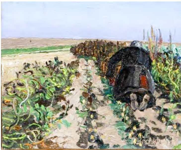
Jakob Bräckle Kartoffelernte 1947 Oel auf Karton 24,5 x 27 cm Signiert und datiert