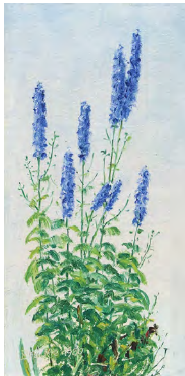
Jakob Bräcke Rittersporn 1980 Oel auf Platte, 19,3 9,5 cm Signiert und datiert