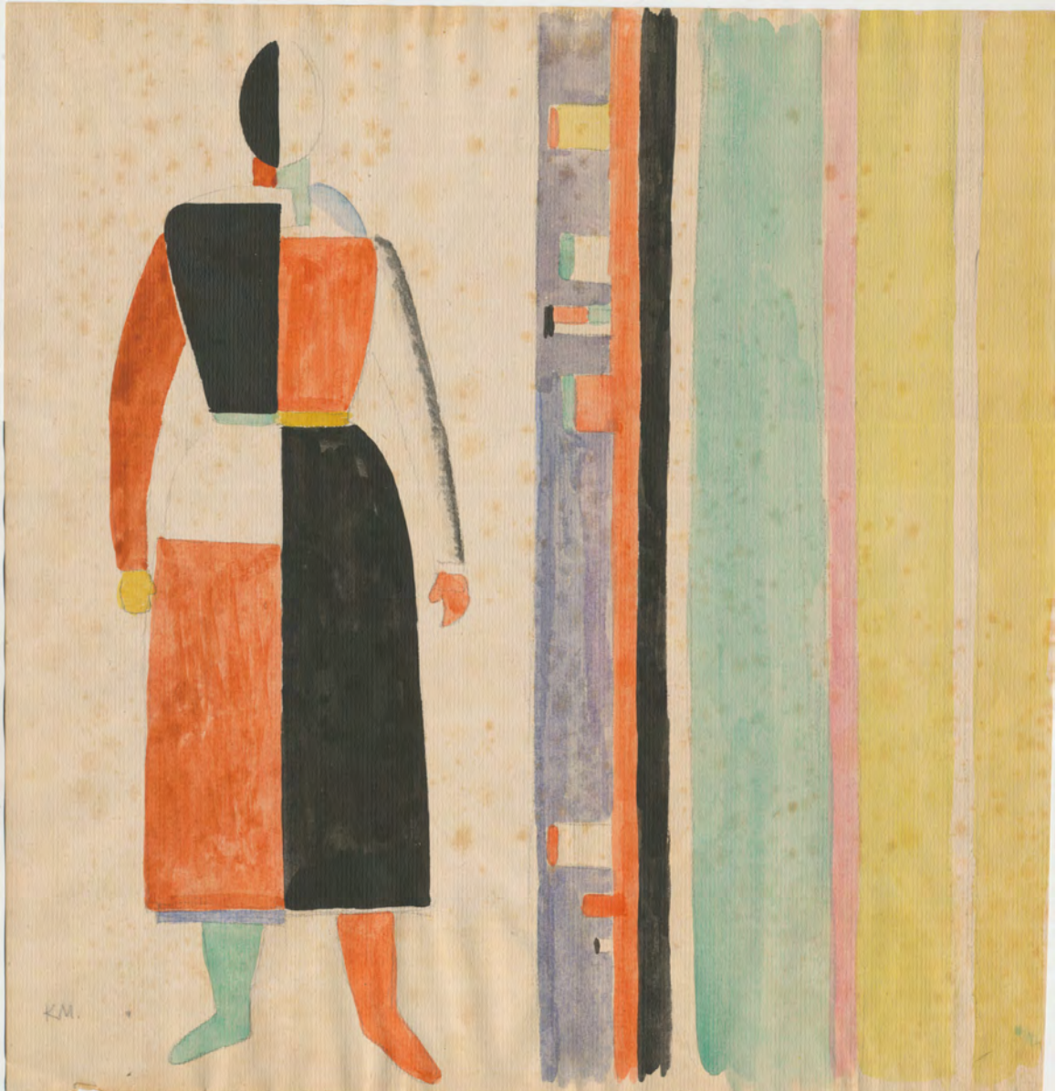
Kasimir Malewitsch (attr.) Frau und Felder Aquarell 29,2 x 27,9 cm, unten linkgs monogrammiert