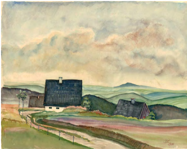
Franz Lenk Gehöft im Erzgebirge Aquarell 1926

Gerade in dieser Verbindung von Vereinfachung und atmosphärischer Dichte liegt die besondere Qualität seiner Malerei: Sie steht am Rand der Neuen Sachlichkeit, ohne sich ganz in deren nüchterne Bildwelt einzuordnen. Vielmehr bewahrt sie eine leise, persönliche Beziehung zur Landschaft, die seinen Bildern ihre unverwechselbare Ruhe und Geschlossenheit verleiht