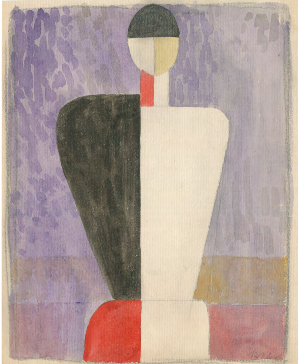
Kasimir Malewitsch (zugeschr.) Aquarell 31 x 24,7 cm, unten rechtsmonogrammiert

abstrakten Konstruktion und den stilleren, von der Landschaftserfahrung getragenen Weg der regional verwurzelten Malerei.