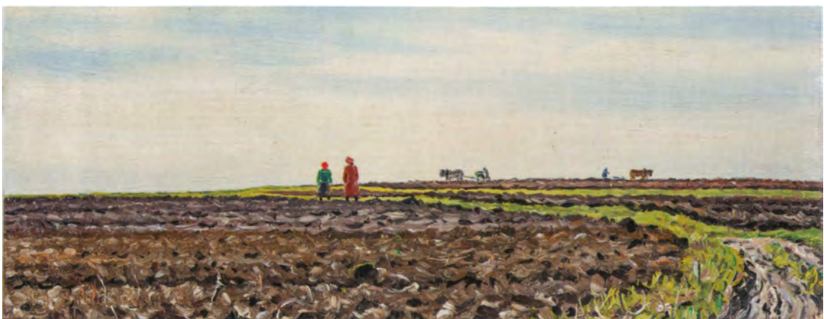
Jakob Bräckle Acker im Frühjahr 1942 Oel auf Karton, 11 x 26 cm Signiert und datiert