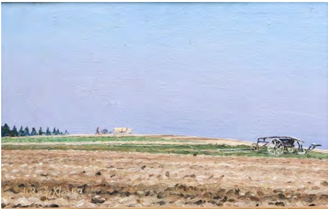
Jakob Bräckle Ernte 1943 Oel auf Karton 27,7 x 36,4 cm Signiert und datiert