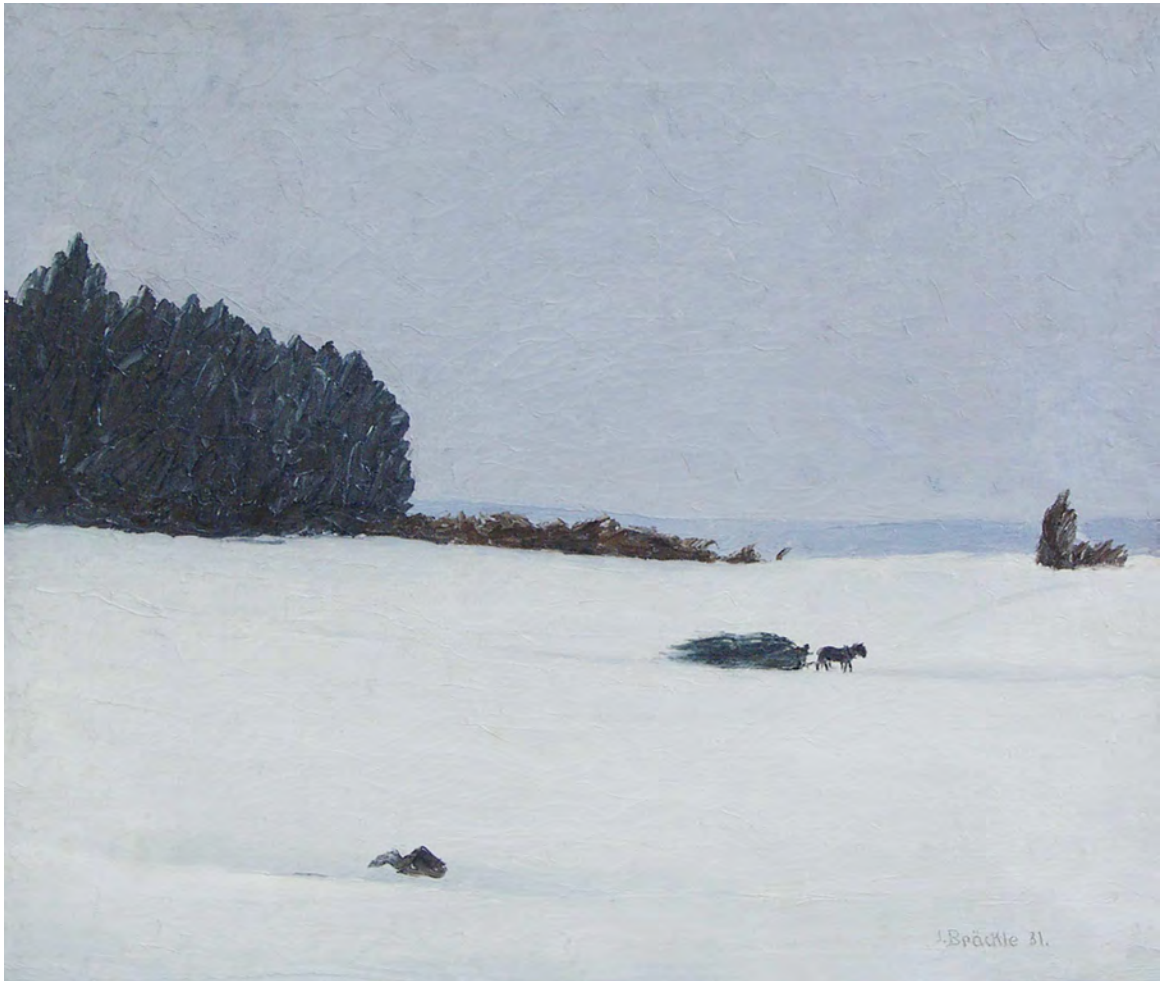
Jakob Bräckle Winter 1931 Öl auf Leinwand, 51,5 x 60,5 cm Signiert und datiert