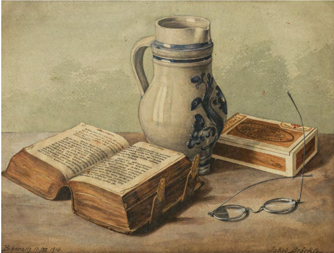
Jakob Bräckle Stilleben mit Steinkrug, Buch und Brille 1916 Aquarell, 31 x 41 cm Bezeichnet, signiert und datiert