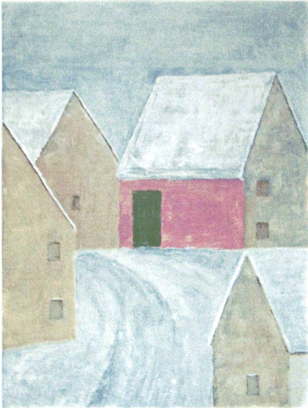
Jakob Bräckle Dorfstrasse im Winter 1986 Farbserigraphie, 40 x 30,5 cm Unsigniert, vom Künstler autorisiert